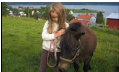
Nærkontakt med dyr har en "magisk" virkning på mennesker.

Vi ser samtidig at mange ungdommer har tunge dager på skolebenken. Vi tror at en dag med frisk luft, tilpassede arbeidsoppgaver, sosialt felleskap med andre ungdommer og voksne vil kunne være en alternativ læringsarena, spesielt innen matte og naturfag.