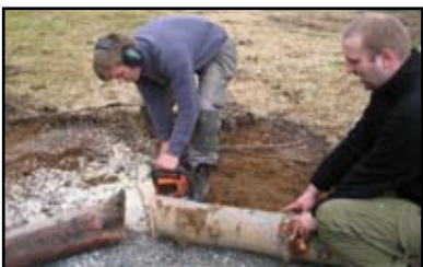
Matte og naturfag i praktisk utførelse.