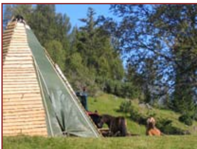
Bygging av lavvo gir verdifull erfaring innen matte og praktisk arbeid.

JOB OG LÆR i Senja Familiepark kan være en samarbeidspartner for skolen.